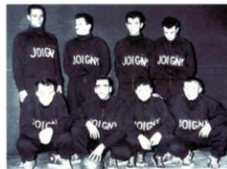
Saison 54 / 55

Il sera membre du comité de l'Yonne de basket entre 1963 et 1996 ensuite il en prend la présidence (1996 à 2008). Il sera aussi membre de la ligue de Bourgogne.